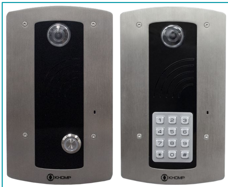
Legenda: Parte frontal dos modelos IP Wall 301 S, IP Wall 301 SR e IP Wall 312 S.