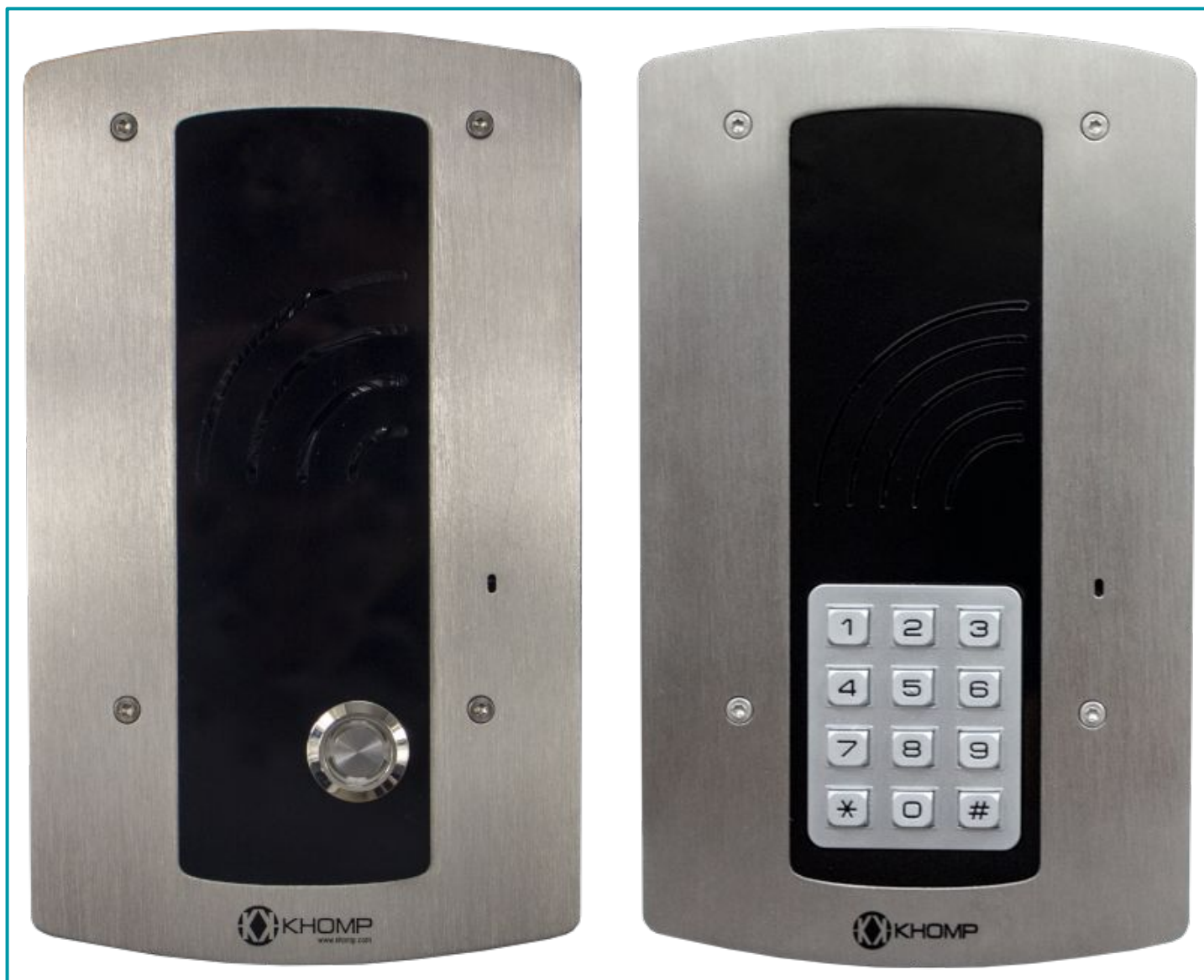
Legenda: Parte frontal dos modelos IP Wall 301 S e IP Wall 312 S.