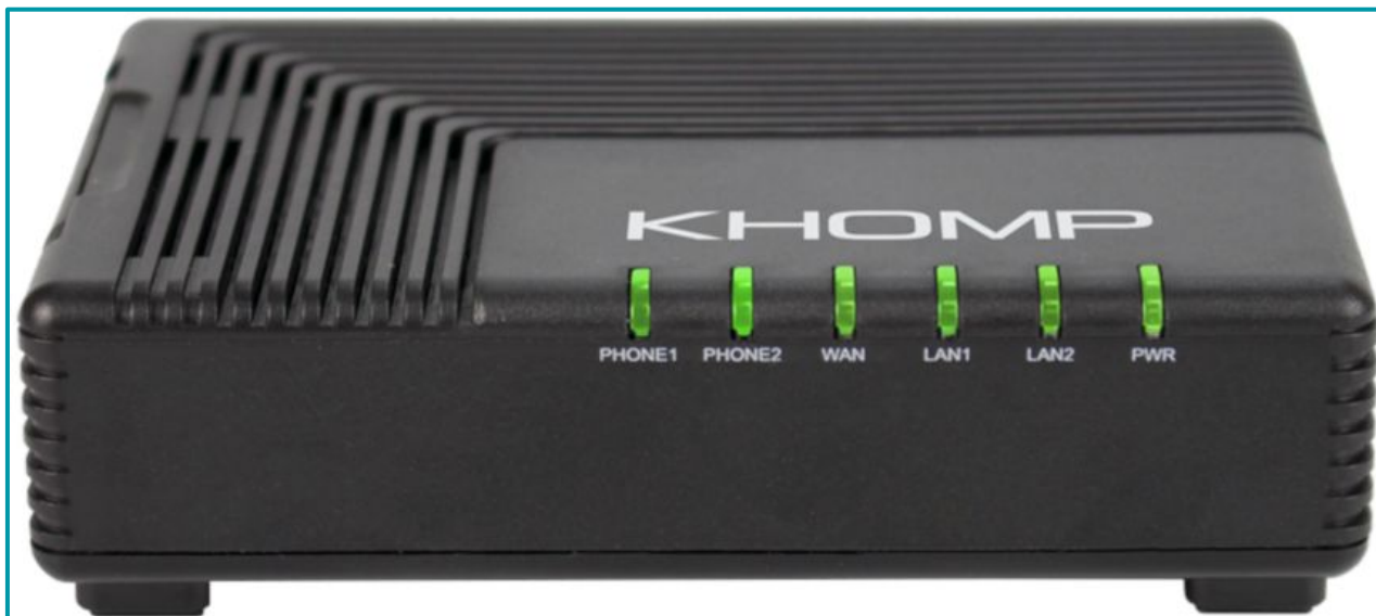
Vista frontal con LED indicadores.