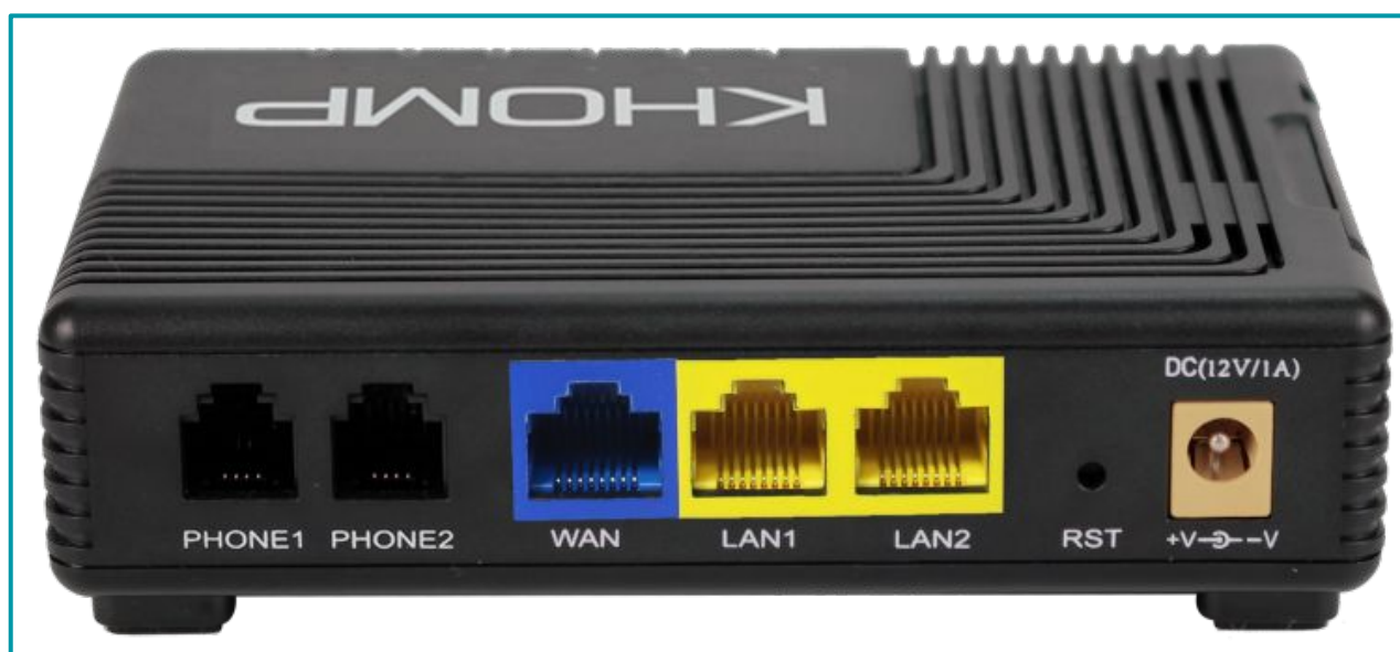
Visão traseira com portas FXS, portas WAN e LAN, botão de reset e entrada para fonte de energia.